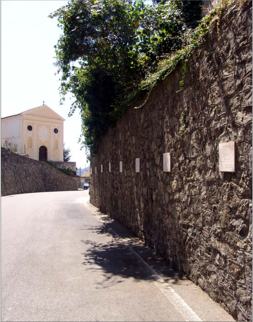
Una serie di poesie su Corso Mattia Preti