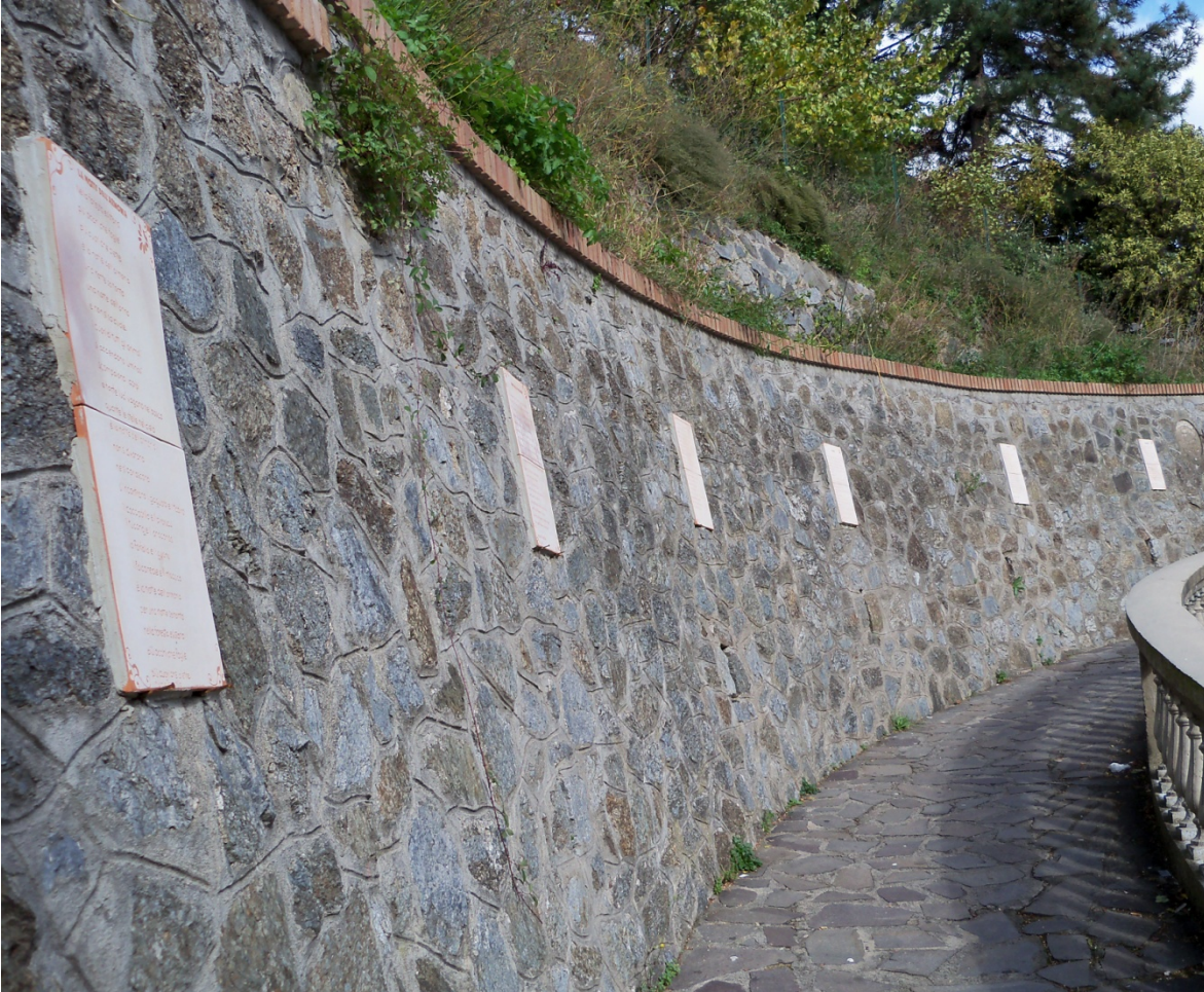
Marcia Theophilo (Fortaleza 1941 - vive e opera a Roma) Quindici poesie dedicate alla foresta amazzonica ed al tema mondiale della biodiversità terracotta ingobbiata cm.60x30 – 2010. Via Ierinise